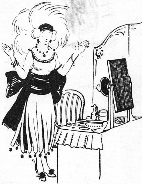
Κανένα μακιγιαρίσμα πιά δεν μπορούσε να ξεαλείψη από το πρόσωπό της τα σημάδια που της άφηναν τα νύχια του χρόνου...

Ο Άνδρέας Λιράν είνε ύποπτη ένα από τα φριχτότερα παθητικά που μπορεί να τούχουν στον άνθρωπο. "Υστερ' από μιά μα-