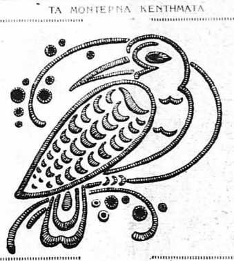
Μοτίφ γιά ἀπορροχμα, πετσέτακια, παιδικὰ φορέματα, κλπ.

Πικραμένο παιδί, Πύργου.—Ἐχω τὴν ἰδέαν, ὅτι πρόκειται περὶ σταφυλοκόκ- κου, ὁ ὅποιος χρειάζεται ἰατρικὴν θεραπείαν. Πάντως ἡ φίλη σας νὰ κἀν διαίταν στήν τροφή της, ν' ἀποφεύγῃ τ' ἄμυρα καὶ τίς σαλτσες, νὰ τρῶ πολλὰ φρούτα, νὰ κἀν τακτικώτατα μπάνια καθαρϊότητος, νὰ καθαρίζῃ τὸ πρόσωπό της μέ τὴν λοσιόν πού ἀναφέρω παραπάνω καὶ νὰ μὴν μετα- χειρίζεται οὔτε κρέμα, οὔτε πούδρα, ἀλλὰ μόνον τάλκ, μέ τὸ ὅποιον νὰ κἀν ἑνα ἑλαφρὸ μασσάζ στὸ πρόσωπό. Τὸ σπάσιμο τῶν σπυριῶν ἀπαγορεύεται.