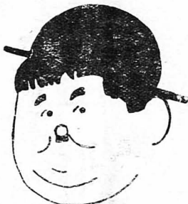
Ο Ὀλιβέρ Χάρντι, ὁ περίφημος «Χουτρός» τοῦ κινηματογράφου

«Ὅταν ὁ τζιτζικας τραγουδᾷ ὕστερ' ἀπὸ τὸ ἡλιοβασιλεμα, κάποιος θὰ πεθάνῃ τὴν ἄλλη μέρα τὸ πρωῖ...»