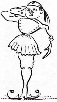
—Παρών !... Διατάξι, κύρ' επιλοχία !...