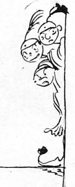
Δυὸ - τρεῖς ἐκῶνοι πληροῖσαν περιέργου

Καὶ ὄλοι σπρωθῆκαν γιὰ νὰ ἰδοῦν. Καὶ εἶδανε σὲ λίγο. Εἶδανε τὸν επιλοχία, Φάνικε ὁ κύρ' Διοικητῆς !