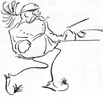
Καὶ χτύπησε τὸ χέρι του σὸν τραπέζι...

—'Επιλοχίας εἰμι ἰγὸ, οὐρέ Μήσοι, ἢ κατοικία ; 'Ε ; 'Επιλοχίας, εἰτα, εἰμι ἢ κατοικία ;