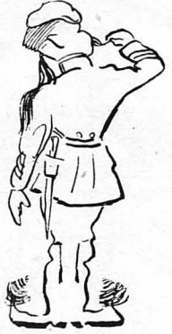
—'Η εἰμι επιλοχίας ἢ δὲν εἰμι !...