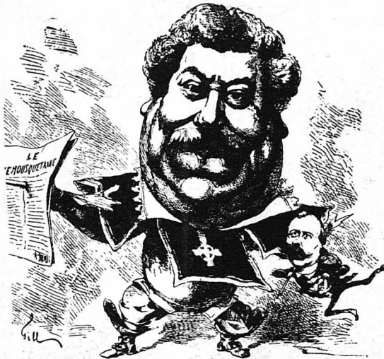
Ο 'Αλέξανδρος Δουμάς πατήρ και τά δύο δοξασιμένα παιδιά του...ό γυιος του και τό έργο του «Τρεις Σωματοφύλακες».