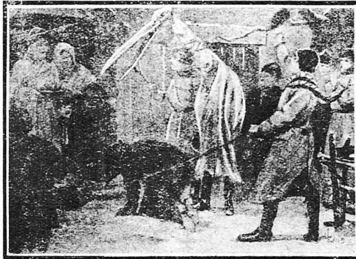
Τά Κάλαντα των ζώων στην Πολωνία

Άλλοτε πάλι ό οικοδεσπότης κερνάει άφθονη ρακή στους μεταμφιεσμένους νέους και τότε δέν άργεί θέσθαι τό κοπάδι νά μεθύσιν και ν' άρχισή τά παραπατήματα. «Ε, λοιπόν! Νομίζετε ότι ύπάρχει ποιά ξεκαρδιστικό θέαμα από τις τρέλλες