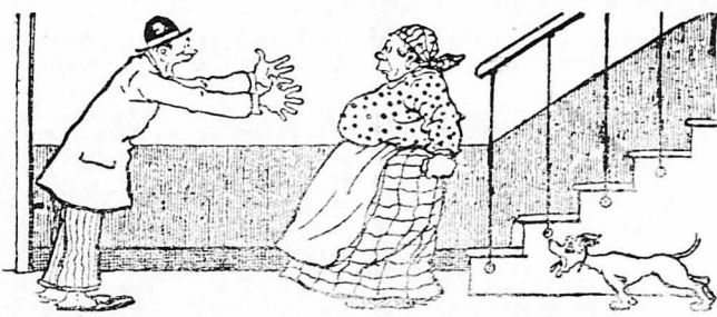
Ἔβαζε τίς φωνές, ἔβριζε τήν καυμένη τῆ θυρωρῶ...

Φαντασθῆτε τώρα τῆ θέσι τοῦ Στεφάνου Μπουρακάν πούχε βρῆ ὁ ἄνθρωπος τῆ ἡσυχία του σ' ἐκεῖνο τὸ σπίτι... Τὸ ραδιόφωνο τὸν ἔκα-