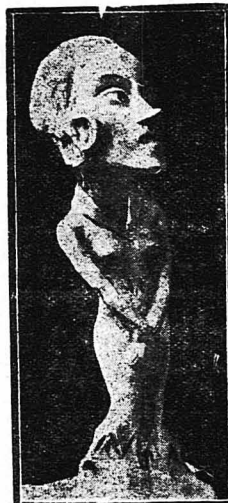
Η Σβάνσον (Γελοιογραφικό άναμμάτι του Σ. Μαγιάρ)

Έγώ φυσικά δεν ξέρω άν εχει δίκρη ή άδικο. Όπως κι' άν είνε όμως, έτσι είμαι επαγμένη και μου είνε πολύ δύσκολο ν' αλλάξω. Έπειτα δεν πρέπει να ξεχνάτε ότι είμαι ήθσοποιός... Τέ-