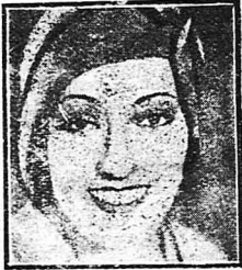
Η Γκλόρια Σβάνσον, όπως είνε σήμερα

[Ένα χαριτωμένο άρθρο της Γκλόριας Σβάνσον, πού δημοσιεύθηκε εσχάτως στο "Αμερικανικό περιοδικό «Movie Classic» για τη συζυγική εύτυχία]