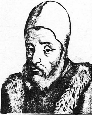
Ὁ πάνσοφος Τζερόλαμο Καριντάνο

Τὸ Πρωτοχρονιάτικο καρφί τῶν Ρωμαίων. Πῶς μετρᾶνε οἱ Ἑσκιμῶσι. Ἡ ἀβροίσει τῶν ἰθαγενῶν τῆς Νέας Γουίνεας. Οἱ μεγάλοι μαθηματικοὶ κ' οἱ ἀνθρωποφάγοι τῆς Αὐστραλίας. Πῶς μετροῦσαν οἱ ἀρχαῖοι ἔμποροι. Ἡ πρῶτος ἀβροίσεικὴ μηχανὴς τῶν Ρωμαίων. Οἱ Ἀραβικοὶ, οἱ Ἑλληνικοὶ κ' οἱ Λατινικοὶ ἀριθμοί, κλπ.