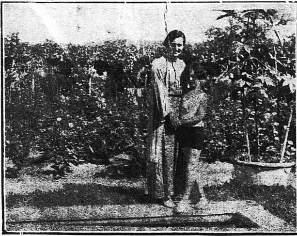
'Η πριγκίπισσα 'Ασπασία με τὴν κόρη της 'Αλεξάνδρα, φέρουσαν μαγιὸ μάνιου, στον κήπο τῆς ἐν Βενετία ἐπαύλειῶς τῆς

—Ναί, ἀπάντησε θαροετὰ και με βεβαιότητα ὁ 'Αλέξανδρος.