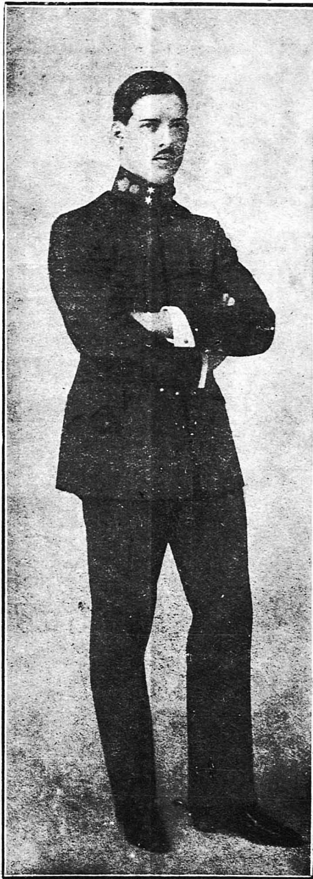
Ο βασιλέας Αλέξανδρος όταν ήταν ύπολοχαγός του Πυροβολικού

Στό ίδιο αυτό σπιτι τής οδού Φιλελλήνων έπαιαν μαζί με τήν οικογενεία τής Ασιασίας και ο γιοραός παππούς