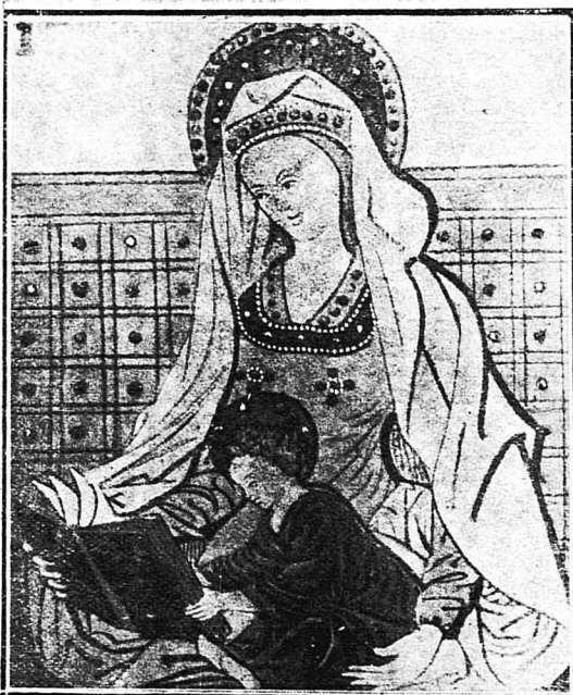
Η ΠΑΝΑΓΙΑ ΚΙ' Ο ΧΡΙΣΤΟΣ (Σμάλτος τοῦ Πενιγκῶ)

Οἱ γονεῖς τοῦ παιδιοῦ ποὺ σκοτώθηκε ἔτρεξαν τότε καὶ κατηγοροῦσαν τὸν Ἰησοῦ πῶς αὐτὸς ἔριξε κάτω ἀπὸ τὸ λακοτὸ τὸ παιδί τους. Τότε ὁ Ἰη-