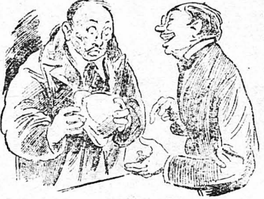
—Τὸ ρολόγι αυτό είνε τοῦ γαμπροῦ μου...