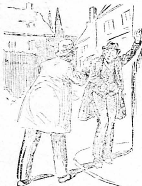
—Ψηλά τὰ χέρια !...