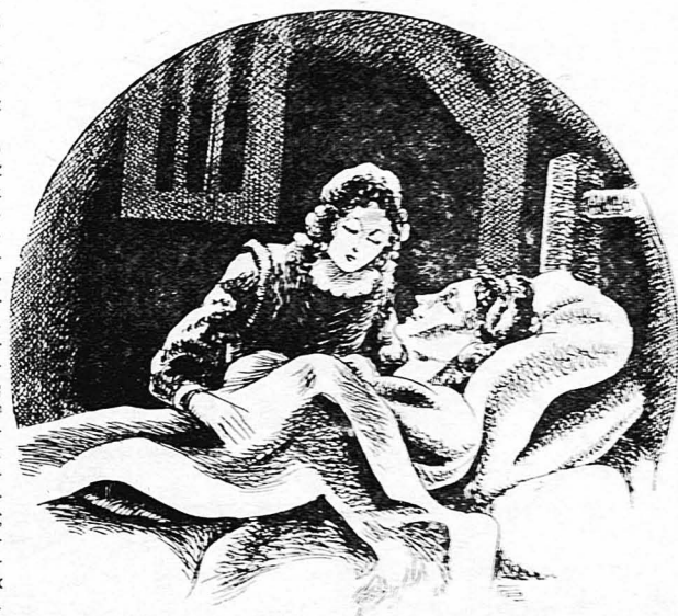
—Όσοτε μικρό μου ήσυχέ, έσύ μ'έσωσας!

—Σ'ε έλεγα! έβασζε τότε ο μεγάλος άγοντής, Συγχρόνως πέταξε στον ιδιοκτήτη τού όποσασατικού ένα πούγ-