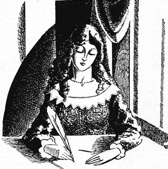
Καθισμένη μπρὸς σ' ἕνα τραπέζι, ἔγραφε...

«Ἀρχισα νὰ γράφω τὸ Ἡμερολόγιό μου αὐτὸ ἕνα θράδυ ποὺ