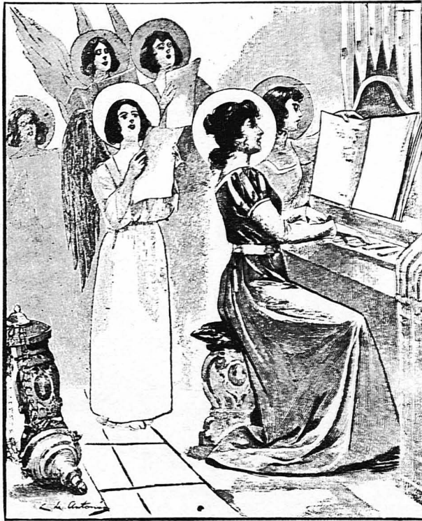
Χριστός γεννιέται σημερον εν Βηθλεέμ τη πόλει οι ουρανοι αγαλλονται, χαίρει η Κτίσις όλη!...

— 'Η γυναίκα δεν μπορεί να νοιώση τους υπέρποχους άνδρας, τα μεγάλα πνεύματα. Τους εκτιμά όμως και τους θαυμάζει.