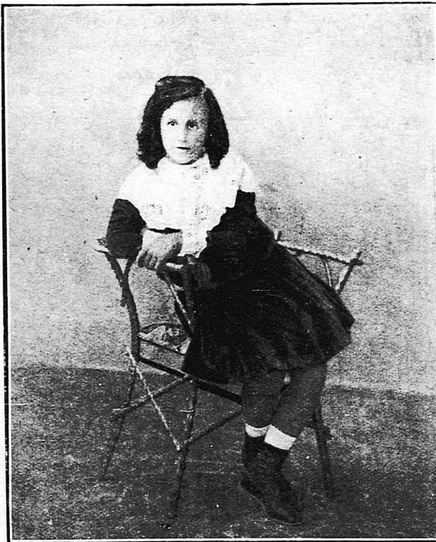
Ἡ πριγκίπισσα Ἀσπασία εἰς ἡλικίαν ἕξι ἐτῶν