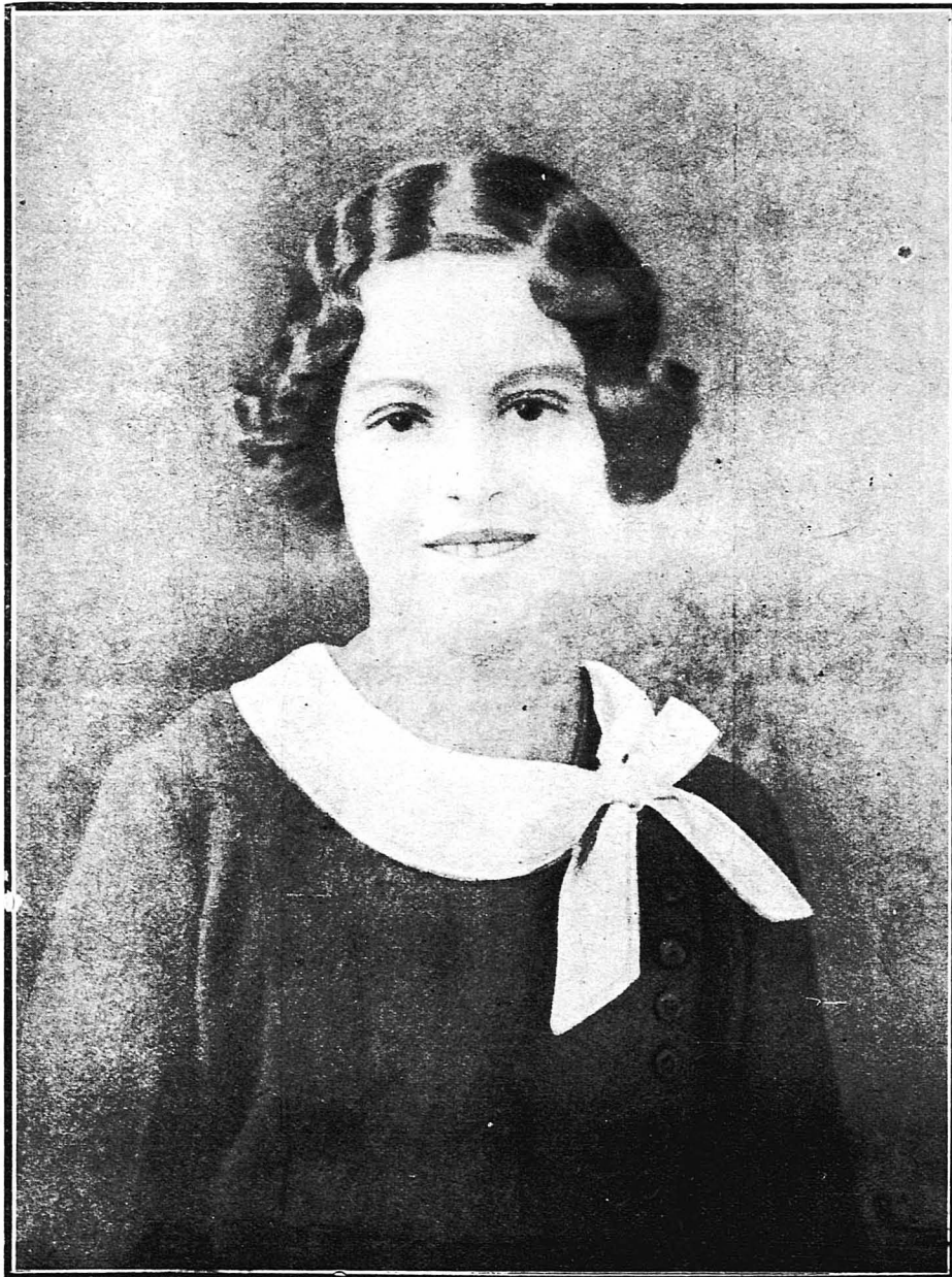
Η μικρά κόρη της πριγκίπισσας Άσπασίας, πριγκίπισσα Άλεξάνδρα

Ο Πέτρος Μάνος ξαφνίστηκε. —Τί συμβαίνει, μητέρα ; ρώτησε