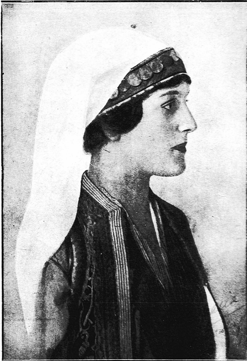
Η πριγκήπισσα Άσπασία, με ένθική Έλληνική άμοίεια

—Και βέβαια. Ο κουνιάδος μου (έννοει τον τώσ βασιλέα Γεώργιον