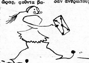
Ἐνας εὐζῶνος τοῦ ἔφερ’ ἕνα τηλε- γράφημα.