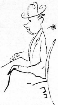
—Ὡστε μόνον τρι- ἄντα εἶσθε, κύρ ἐπιλο- χία ; ρώτησεν ὁ δά- σκαλος

—Μετὰ τὸν προδιδασιμὸν, λέου νὰ ἀφουσιωθῶς ἀρμενιανὸς εἰς τὸν