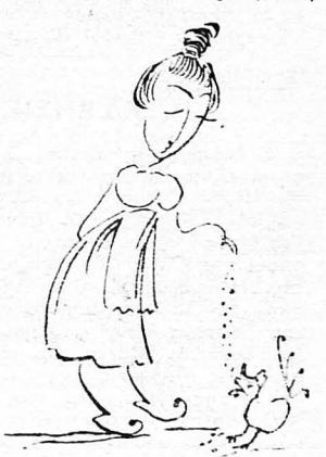
Μετὰ τῆς περιλάμπρου Λάμπρου