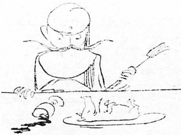
Πένθος χύθηκε στο πρόσωπό του...

τουρβάζονται βίον τον ει- κογονεϊακόν... 'Αμέμμενους πλέον, διά τὰ πρηθέρον, θά διατελώ άκραδάντους οικογενειάρχης... Θά ύπη- ρηφανεύομαι ότι ή σημερινή κυβέρνηση' επίλεισφόρησεν διά της ήμετέρας προνα- υγογής κι θά περιορισθώ εις την προϊθάβην του ήτέ- ρου τρυφρού ήμίσεως, κα- τά τού δη λεγόμενον !.. 'Εξείνη τη στιγμή ένας εϊζωνος τού έφερεν ένα τη- λεγράμμα.