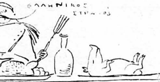
Προσέλθετε εις τράπεζαν καινήν...

«έπαξιωματικός», είδε στό ταψί τό γουρνοπούλο, οδοφνημένο, ξερο- πυλωμένο, σάν καλονημένο φύλλο μπαζλαβά, άχνίζον, όρεκτικό και προ- κλητικό, σάν νύμφη λαχταριστή επί νυφικής παστάδος, καλοστολιμέ- νη και καθαρή, σάν γάμοσ τού στομαχού και τού λάργγγος. Και γρού- ζοντας, είπε στόν παρακαθήμενο ύποδεκαένα Κακαθιά, τόν όποιον έ- παιρνε ως ύπασπιστήν πάντοτε μαζί του : —Αί, τί νά γίνη, χάθρη πού χάθρη τού συνοικέσιον, δέν πριμα- ΰσεις, κάνε, κανένα μιζέ, ούδ' Κακαθιά, άπόυ εκείνη ίζει τη γουρνο- πούλα, γιά νά σάς ύψηθώ κι ίγώ καλές γιορτές ; ... Και συμπλήρωσε, άναστενάδας : —Κι τού χρόν', πιδιά !.. Καλά Χριστούγεννα κι' οούτι ίέξαστους ίπ- θυμοσιν !..