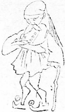
Της κόρης του Προέδρου της Κοινότητας

‘Η καμπάνες χτυπούσαν χθές βράδυ πιά χαμόσινα στον Έσπερινό, χτυπούσαν και δονούσαν τὸ ψηφὸ τὸ δειλινὸ ἀπὸ χαρά... Χτυποῦσε σὰν καμπάνα κι’ ἡ καρδιά τοῦ Δήμου Τυροδῆμου, ἐπιλοχίου τῶν εὐζώνων, ἐξ Ἀποδοτίας καὶ ἐδῆ Λομπιτινοῦς.