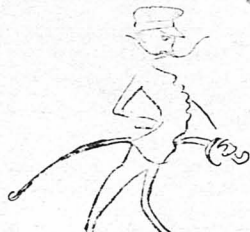
—'Ιπακουλουθει βαθμός άν- θυπασπιστού !..

Αυτό τό κατάλαβε άμέσως ό έπιλοχίας και φώναξε : —'Τί κυβέρνηση' είνε αυτή, πικραλω, πού μι θέτ' βιαιούς ίν άποστρατεί, ίνώ ίγώ ήσθάνομαι καλώς έχοντα κι καλώς ύπάρχοντα τό σωματικά μου προυτηρήματα ; ... Είνε δίκην νά τιματίσιον ίγώ τού στάδιόν μου τόσον άδίκους ; Είνε δι- κην, πικραλω, νά μη γίνου εύάμορστων ζευγών, γιατί μι καταδιώκ' ή ίσχύουσα πολιτι- κή ; ... Δέν είμαι μαθές, ορφαί- ους, διακούς, ίπρωτής εις τούς συζυγικόν βίον, με φρόνημα ί- ροντικόν μέγχι τρίτου ούρανού ; Τότις ; ... Είνε ή όχ' βιαοπρα- γία αυτή της κυβέρνησεως κατά τού ίαντού μου ; ... Κατά τού μέλλοντός μ' κι κατά τού έρω- τός μ' ; ... Κυβέρνηση', σ' λέει ! Μην κάμω κατά κάτ' κατά τ'ν 'Αθίνα κι την κατακρουγγή- σον !..