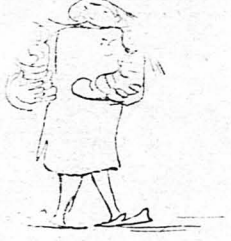
Εις τούν τουρβάζονται βίον τούν οικογενειακόν !..

—'Η ζώττες γεννούν τακτι- κά. Μεγαλειότατε, στό χωριό μας, απάντησε χωρίς διόλον νά τά χάση ή Ξενοδόχισσα, μόνο ό βασιλιάδες περνούν σπάνια... —'Ο Γεώργιος Α' έγέλασε γιά την έξιστην απάντησι της χωρικής κι' ελήφρωσε τά δια- κόσια φλορίνια.