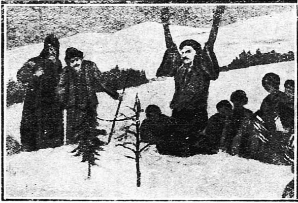
ΤΑ ΧΡΙΣΤΟΥΓΕΝΝΑ ΤῶΝ ΑΤΣΙΓΓΑΝῶΝ.—Ἡ μάγισσα ποὺ παντρεύει τὸ δένδρο τῆς ζωῆς μὲ τὸ δένδρο τοῦ θανάτου...

Ἡ Μοραβία μὲ τ' ἀναρίθμητα βουὰ τῆς καὶ τὰ πυκνὰ ἔσθη, εἶνε ἡ πὶό παράξενη χώρα ποὺ μπορεῖ νὰ φαντασθῇ κανεὶς. Ὁ ταξειδιώτης ποὺ τυχαίνει νὰ