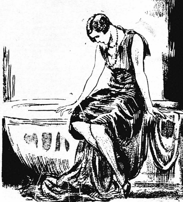
Τὴν εἴρισκα νὰ κάθεται στὴν ἄκρη τοῦ ἀλαβάστρινου λουτήρος...

Τὸ σκάνδαλο, τὰ ἐρωτικὰ σχόλια τὸν ἐφημερίδων, ὁ σαρκασμὸς τὸν σαλονίων, ἡ ξαφνικὴ ἀπόπειρα τῆς Φάννου Χάρουελ, ποὺ ἔδειξε τὴν ἀγατοῦσε πιὸ πολὺ τὸν Πῶλ, ἄλλα αὐτὰ μπῆκαν σάν θιέλλα στὸ σπῆτι