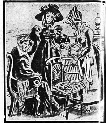
—Δεν μπορούσε να πεθάνη πιο μπροστά από τον ό βάνουσο!... είπε η κόμισσα ντε Σαμπλά.

Η μυστηριώδης δολοφονία του πυργοδεσπότη κ. ντε Μαρσελάνζ. Το μίσος της πεθεράς του και της σύζυγού του. Η άμνηστια της δικαιοσύνης. Το περιλαίμιο του σκύλου. Η σύλληψις δύο υπόπτων. Η συνταρακτική δίκη. Όπου κανείς δεν τολμάει να κατηγορήσει τους πραγματικούς δολοφόνους, κλπ.