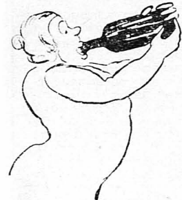
Πίνανε μπόρα με το μπουκάλι, για να φανούν πιο εύγενείς!...