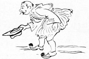
Έτρεξαν να το θαυμάσουν ο πρόεδρος και τα κοινοτικά συμβούλια!...