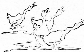
Γαυγίσματα, λοιπόν, και κακαρίσματα, φωνές κι' αλαλητό!...