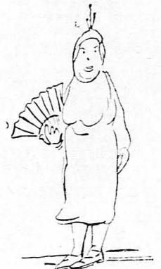
Ή κυρίες φορέσανε Εύρωπαικά!...