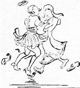
Χορεύανε όλοι παιδιά στο χωριό Εύρωπαι- κούς χορούς!...

Ένα μόνον ζήτημα βασάνιζε τώρα το δάσκαλο :