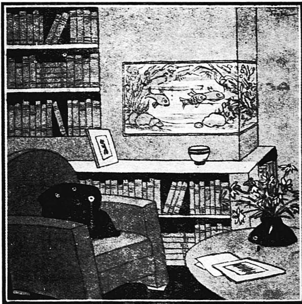
Γραφεῖο μετὰ μοντέρνα βιβλιοθήκη καὶ γυάλα μετὰ χρυσοφάρα

Πτωχὴν Πρωσφρυγοπόυλιν.—Γιὰ τὸ δέμα σας, σὰς συνιστῶ τὴν κρέμα, τὴν ὁποίαν συνιστῶ καὶ παραπάνω στὴν «Μικροῦλαν». Νὰ προτιμάτε γιὰ τὸ πλάσιμο τοῦ προσώπου τὸ νερὸ τῆς βροχῆς καὶ ν' ἀποφεύγετε τὸν ἥλιο καὶ τὴν φωτιά.