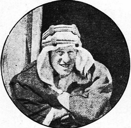
Ο συνταγματάρχης Λώρενς

Ο βασιλεύς χωρίς στέμμα. Οι θριαμβικοί του συνταγματάρχου Λώρενς. Η επέκτασις της Αγγλίας στην Ασία. Τρέμπιτς Λίνκολν, ο άνθρωπος που άλλαξε τις προσωπικότητες. Ένας ακληρός αγών για την κατάκτηση του Αφγανιστάν. Η πανωλεθρία του Λώρενς και η άντεκδικήσις του, κλπ. κλπ.