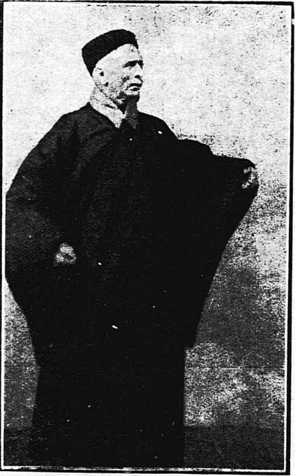
Ο Τρέμπιτς Λίνκολν