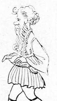
—Μωρέ, τώρα στά γεράματα θά με μάθετε περπατιού έμένα ;