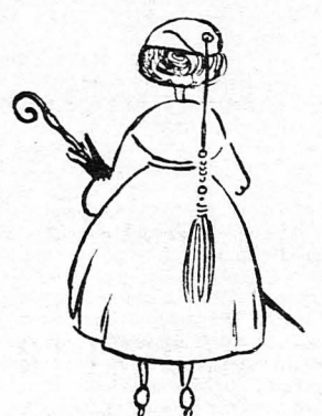
Νά μή φορούνε πλέον κοινοτόμια χωριάτικα