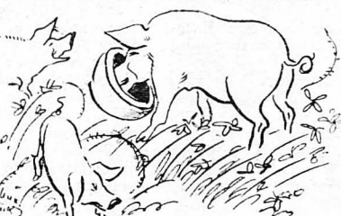
'Ολο με τά γουρούνια θά ζοίμε έμεις ;