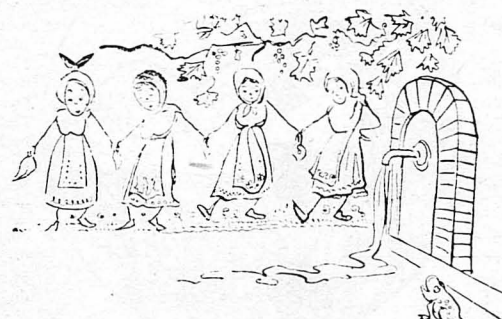
Δέν χορεύον τά κορίτσια σας, παρά τόν χρόνο μιά φορά.