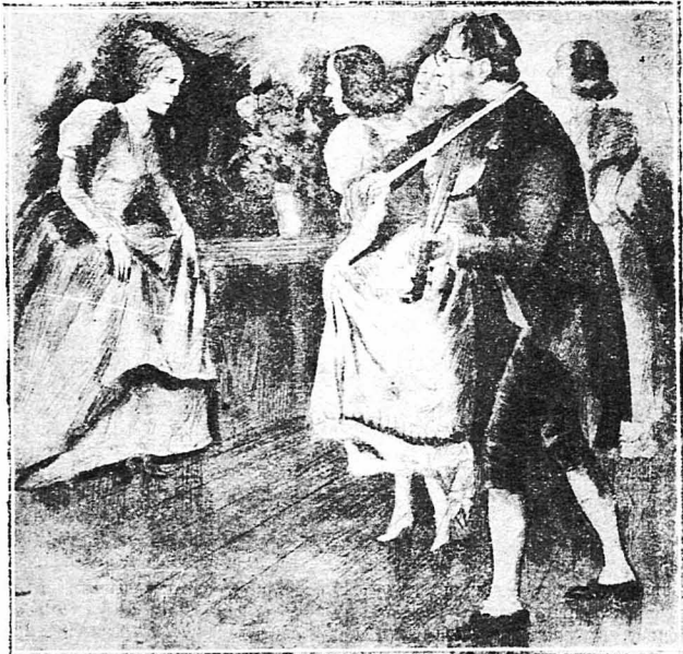
Η Ταλιόνι καθοδηγούσα στο χορό την Έμμα Λιέρυ

Όστερα από πέντε χρόνια, το 1847, ή Μαρία Ταλιόνι άφησε την Όπερα του Παρισιού και πήγε να εγκατασταθεί στην Ιταλία. Πρώτα κάθισε λίγο καιρό στην περίφημη «Κά νι» Όπερας της Βενετίας, σ' ένα από τα όμορφότερα παλάτια της κι' έπειτα