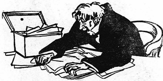
ΦΟΛΕΜΠΑΡΜΠ.—Δέν λέτε καλύτερα πώς είνε οι «Τρείς Σωματοφύλακες» σε δεκάξη τόμους !...