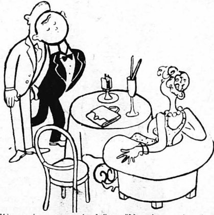
Μην μπαίνετε μπροστά σ' έναν άλλο κύριο, πού πρόκειται νά χορέψη με μιά κυρία τού γούστου σας !...

Όταν πάτε σ' ένα σπίτι νά χορέψετε, δέν είνε βέβαια δυνατόν νά χορέψετε με' όλες τίς νέες, πού θά βρισκονται εκεί. 'Αλλά επίσης δέν είνε καθόλου σωστό νά περιορισθώτε νά χορεύετε μονάχα με διὸ-τρείς, έξαινες πού χορεύουν καλύτερα ή έξαινες πού σάς άρέσουν περισσότερο. Θυσιάζετε από ένα χορό και γιά μιά απ' αυτές πού δέν σας άρέσουν και τόσο και τούς ύπολοίπους μοιράσατε τους, σέ άρακά κάπως διαστήματα, στις ντάμες τής άρεσκείας σας.