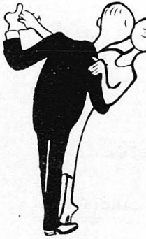
Μην δείχνετε πολύ τρυφερό προς την ντάμα σας, τήν ώρα πού χορεύετε μαζί της !...

[Τί γράφει ένα πρωτότυπο «Εγχειρίδιο Χορού», πού εξέδωθη τελευταία στη Γερμανία]