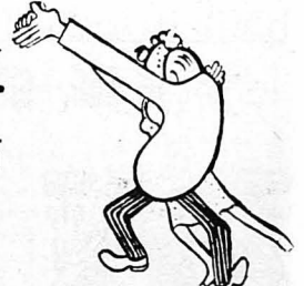
Μην κάνετε εξωφρενικές φιγούρες, πού προκαλούν τά γέλια τών άλλων !...