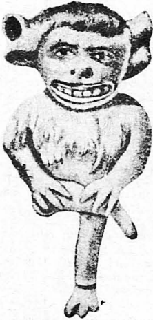
Ο Διάβολος της Μητροπόλεως

Ο πανικός των κατοίκων του Καμμέρινγκαμ. Ο διάβολος της Μητροπόλεως του Λίνκολν κι' η μακάβρια «συμμορία» του. Ο καλόγερος - φάντασμα, που γυρεύει ένα μυστηριώδη θησαυρό. Το τρομαχτικό φάντασμα με το κεφάλι - φανάρι. Η απρόοπτη περιπέτεια δυο έρωτευμένων. Το «περιπλανώμενο κίτρινο φως». Τα σκάνδαλα του τρελλού διαβόλου του Λίνκολν, κτλ.