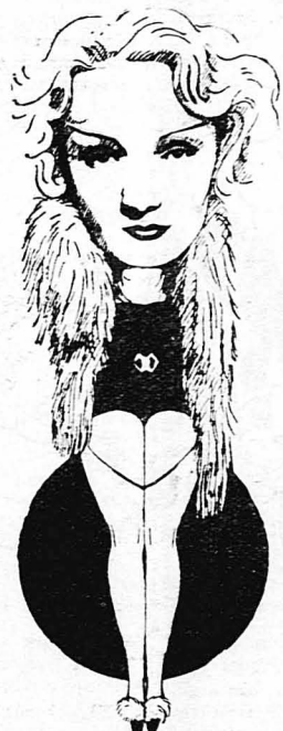
Μιά χαριτωμένη γυλοισογραφία της Μάρλεν Ντήτριχ

Πού γυρομισθίσε φίλμ από το «Στολίκο της Αύτοκτονίας», δέν μπο- ρει να γινή. Στο γύμισμά του από τους 35 ήθοποιούς, πού έλαβαν μέρος, έπέθαναν από διάφορα διστύχηματα οι 15... Σχεδόν ό μισοί... Κατανύ- σσει δηλαδή μοιραίες ο τίτλος του φίλμ αυτού. Κι' αντί «Στολίκο της Αύτοκτονίας», θα μπορούσε να άνομασθί «Φίλμ της Αύτοκτονίας», αφού όσοι έπαιξαν σ' αυτό ήσαν 50 ο)ο καταδικασμένοι σε θάνατο !..