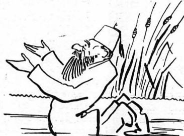
'Ο Κατής γονάτισε εκεί και προσευχήθη

Οί πρώτοι κάτοικοι τής παράξενης αυτής πόλεως πιστεύανε ότι ο βράχος - μανιτάρι ήταν ένα πραγματικό θαλάσσιο μανιτάρι, τήν εποχή πού ή θάλασσα σκέπαζε όλη τή γή, κι' ότι άπολιθώθηκε όταν άπεσούθησαν τά νερά τής θάλασσας.