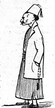
Τοὺς παίρναμε γιὰ ἀνδρες μὲ φουστάνια !...