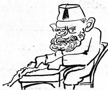
—Νά τόν βρώσω κι' εγώ, τέτοιος πούνα !...