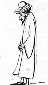
Τὸ πρωί νὰ κι' ἔρχεται ἓνας χότζας !

—Κοίμησε αὐτὸς τὸ κεφάλι του, χωρὶς νὰ μ' ἀπαντήση.