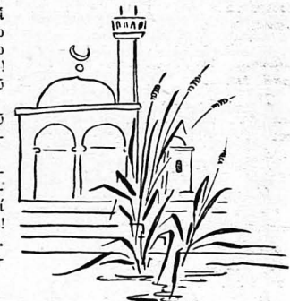
Ἐνα τζαμί, κάτω στὴν εἰσοδο τῆς πόλεως, κοντὰ τὴν λίμνη...

Ἄλλὰ μιὰ χριστιανὴ, σκλάβια τοῦ Κατῆ, ἀκου-