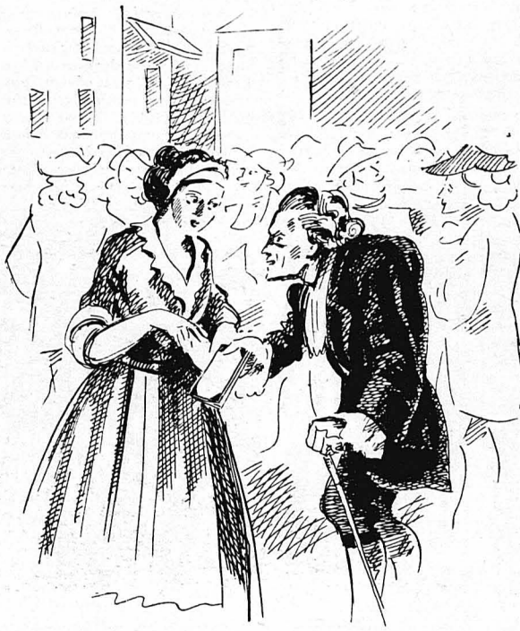
Τῆς ψυθύρισε γογγύρα-γογγύρα μερικὰ λόγια καί τῆς ἔδωκε τὸ βιβλίον...

Μά τώρα φλογίζεταν ἀπὸ τὴν ἀκατανίκητη ἐπιθυμία νά μάθῃ λεπτομέρειες γιά τὴν Αδύη, τὴ φίλη τῆς ντόνας Κρούζ. Γι' αὐτὸ ἀποτραβήχτηκε ἀπὸ τὸ παράθυρο, γιά νά ξαναγορῆσι κοντὰ τῆς. Ἄν ἔμενε ὄμως ἐκεῖ μιά στιγμὴ ἄκομα, θά ἔβλεπε μιά καμαριέρα νά βγαίνει ἀπὸ τὴν πόρτα τῆς ἀριστερῆς πτέρυγος τοῦ μεγάρου καί νά πλησιάζῃ τὸν καμποῦρη, ὁ ὁποῖος τῆς ψυθύρισε γογγύρα-γογγύρα μερικὰ λόγια καί τῆς ἔδωκε τὸ βιβλίον πού κρατοῦσε. Ἐπειτα ἡ καμαριέρα