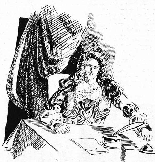
'Ο Γκονζάγκας χτύπησε τó κουδοίνο...