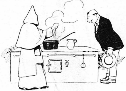
Ἄρχισε ν' ἀνακατέψῃ τὸ φαγητὸ...

Ὅλοι ἀπόφαγαν καμιά φορά, ἐκτός ἀπὸ τὸν Γασπάρ. Ἄν κ' ἔνοιωσε ὁ φοικωρὸς πει-