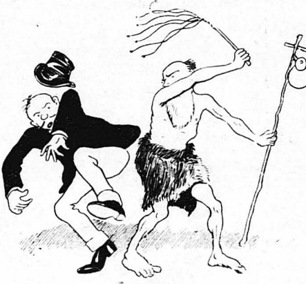
Ἐνας μοναχός, τιμῆς ὡς τὸν Πρόδρομον, ἀρχισε νὰ μαστιγώνῃ τὸν Γασπάρ...