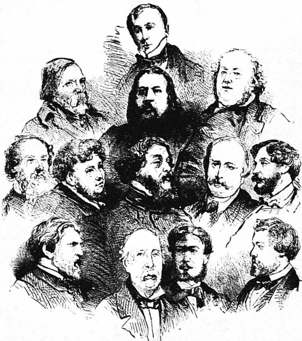
ΕΠΑΝΩ: Ο Αιμίλιος ντέ Ζιραντέν.—ΔΕΥΤΕΡΑ ΣΕΙΡΑ: Ο Ε. Άριστέρων, Ο Μερύ, Ο Γκωτιέ και Ο Ζόλ Ζανέν.—ΤΡΙΤΗ ΣΕΙΡΑ: Ο Ε. Πασκιέ, Ο Σ. Ρτενουαγιέ, Ο Λεόν Γκοκλάν, Ο Ίουλιος Σαντά και Ο Σάλ.—ΤΕΤΑΡΤΗ ΣΕΙΡΑ: Ο Τουργκνέφ, Ο Άμεδαός Πισώ, Ο Η. ντε Καλιά και Ο Π. Σεβαλιέ.

Έξακολουθούσε βέβαια να ζωγραφίζει, να δημιουργή όλοένα και νέα άριστουργήματα. Συγχρόνος όμως έξακολουθούσε και την καλή άκανόνιστη ζωή του. Η άπελπισία που τον έπανε όταν έβλεπε πως δέν ανεγνώριζαν το ταλέντο του, τον έκανε να πνή περισσότερο από πριν, να πέφτι που βαθιά στην άβυσσο της καταπτώσεως. Συχνά, πολύ συχνά, ο Σμπορόβσκι, ενώ έτρεχε όλη τη μέρα δεξιά και άριστερά για να βοηή λίγα χροιάματα για το φίλο του, ήταν ύπαρχομένος να τραγυνηθεί και όλη τη νύχτα στις διάφορες ταβέρνες και στα κακοήχναστα κέντρα, στα όποια ο Μοντιλιάνι σταταλούσε τα λεπτά που του