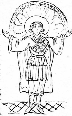
'Ο "Αγιος Δημήτριος

Αυτά μου ήρθαν σήμερα στο νου, πού είνε ή ημέρα κρούα — σάν και τότε — βοσρη, ύγη, βαρεία συν- νεφασμένη και κάτι θλίβει, θλίβει την καρδιά, ενώ ή καμπάνες τής έκκλησίας μαζουά, χτυπούν, χτυπούν, για τού 'Αγιου Δημητρίου την επέτειο, σάν να θέλουν να ζήτησουν μερες ώραιές, παιλιές, και κόσμο ώ- ραίο και ασθηματικό, πού πέρασε και πάει... ΣΤΑΜ. ΣΤΑΜ.