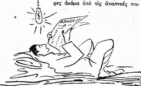
Έστρωσα τή μισοκαμμένη μου κουβέρτα κάτω...

Πολυθρόνες, καναπέδες όλο μετάξο. Καθρέφτες μεγάλοι, σάν την θάλασσα, στους τοίχους. Χαλιά στραμμένα κάτω, κουρτίνες, και αυτές μεταξωτές, έπιπλα πολύτιμα και κάπι λάμπες, ψηλές, σάν ύ-