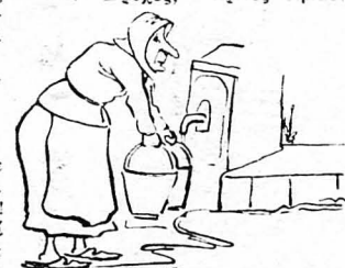
Μιά γρηά στη Βέροια