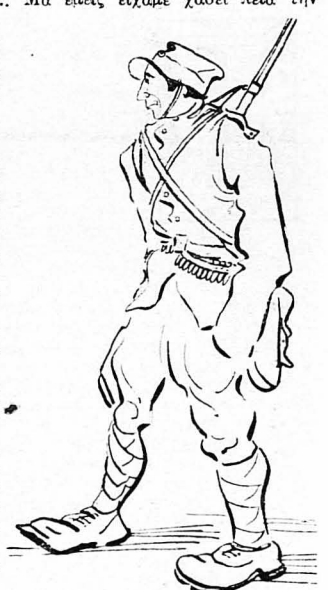
Άρβύλλες, φυσεκλίκια, σακκίδια...

Κι' δταν ήσθε ή διαταγή νά φύγουμε, παρουσιάστρια στο μακαρίτη Άνδρέα Καρκαβίτσα, τού λογογράφου, λο-