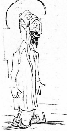
Έκει πού κοιμόταν Ο Άβδούλ Χαμίτ

Ήταν μιά μέρα, σάν και σήμερα, κρύα, βροχερή, ύγρη, μιά ή καρδιάς μας ήσαν ζεστές. Καμίνι !..