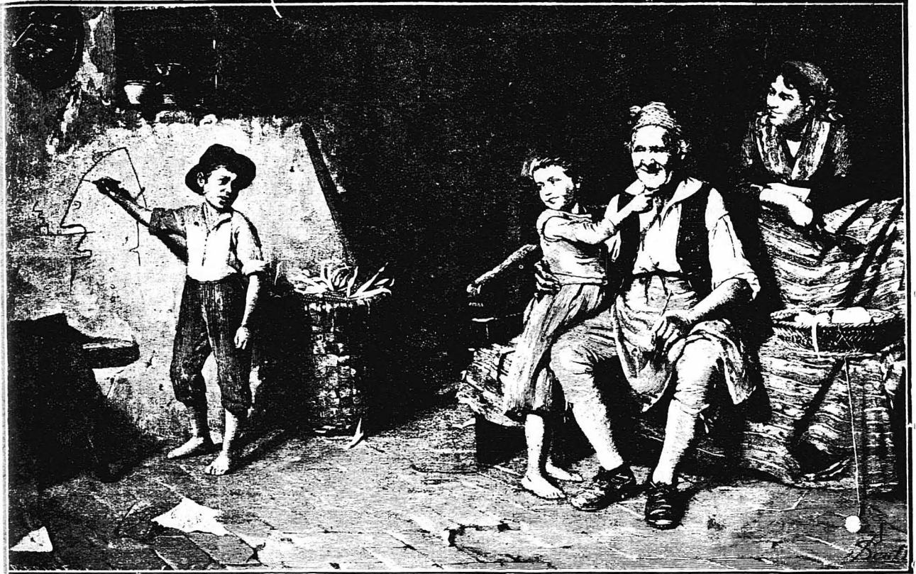
Ο ΜΙΚΡΟΣ ΖΩΓΡΑΦΟΣ