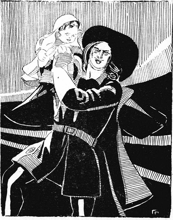
—'Ίδου ή κόρη του Νεβέρ!... φώναξε ό Λαγκαρντέρ.

"Ο βασιλεύς Λουδοβίκος 14ος εί-χε πεθάνει πρὸ δυό χρόνων κι' ό θρόνος της Γαλλίας είχε περιέλθει στό δισέγγονό του τό Λουδοβίκο 15ο. Μα ό νέος βασιλεύς ήταν ά-ζώγια παιδάκι καί γι' αὐτό κυβερ-νοῖσε τή Γαλλία ως αντιβασιλεύς ό Φίλιππος της 'Ουλεάνης, ό ένας ά-