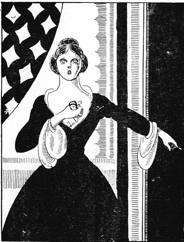
—Αν προαρήσετε έτσι καί ένα βήμα, θα σκοτωθώ !...