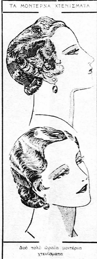
ΤΑ ΜΟΝΤΕΡΝΑ ΧΤΕΝΙΣΜΑΤΑ