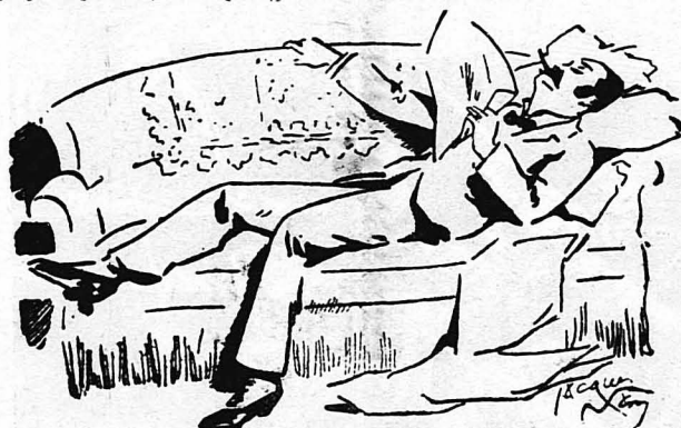
Ξαπλώθηκε στον καναπέ τού γραφείου κι' έπεριμενε ήσυχος...

Άφού έφαιναν ο δύο μάρτυρές του, ο κ. Ύγγελβουστ ξαπλώθηκε