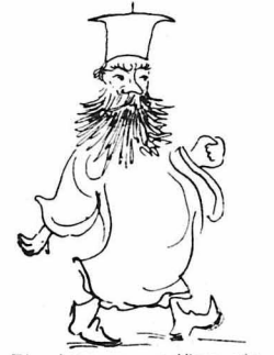
Τέ νέετα του μοιάζανε σάν θεμοιένια σάχια...