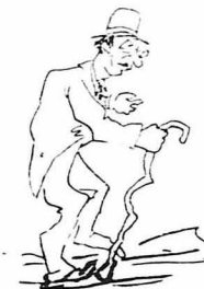
Κουτοφ, ραιφός, σάν τή ψυχή του και τή γλώσσα του!...