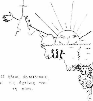
Ο ήλιος άγκαλιασε με τις άχνης του τή γή.