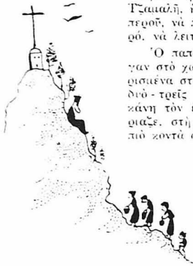
Άπάνω στό Πύλο Σταυρό...

Δέν είχε γυαλιόσει, καλό-καλό, ή αέρα ψηλά στον ούρανό και ξενιθιάνε ή τρείς νοικοκυρές, ή Πέλο το μαζαροίτη Τζαμάλ, ή Τριμεντίνα ή Λενιώ κι ή Νίτσα ή Πιπερού, να πάνε άπάνω στο βουνό, στον Πύλο Σταυρό, να λειτουργήσουνε στο ρημοζέλι.