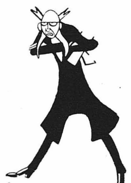
—Δηλαδή... δηλαδή είχες ύποχρέωση να πεθάνης!...

Κι' έφυγε, χτυπώντας πίσω του την πόρτα, έτσι που τρανάχτηκε όλο τό σπίτι.