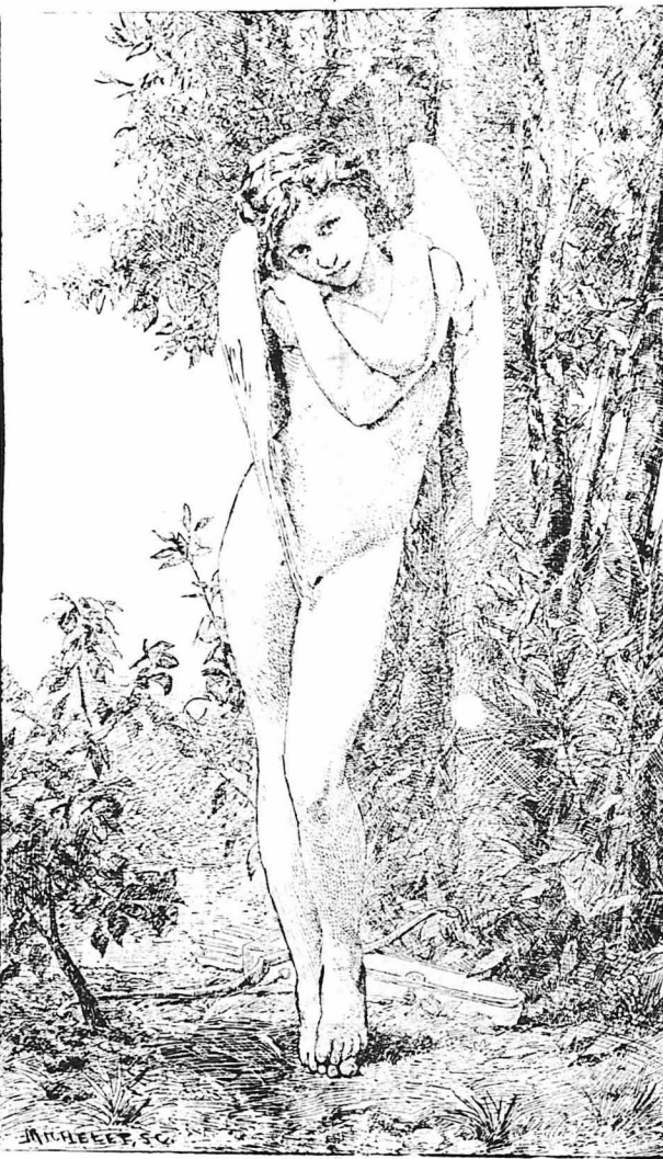
Ο ΑΠΟΓΟΝΤΕΥΜΕΝΟΣ ΕΡΩΤΑΣ (Έργον του Μπουκερό)

Και στον πιο άγριο πόλεμο, ο στρατιώτης διατηρεί έστω και μια άμυδα έλπίδα ότι μπορεί να έπισητη έπιπονος σπιτι του. Όσοις απομασεί έμωσ να λάβη ενεργόν μέρος στο επαναστατικό κίνημα της Ρωσίας, έστετε συγκρότους να λάβη και την άπομασι ότι ή μέρες της ζωής του ήσαν πια μετοημένες.