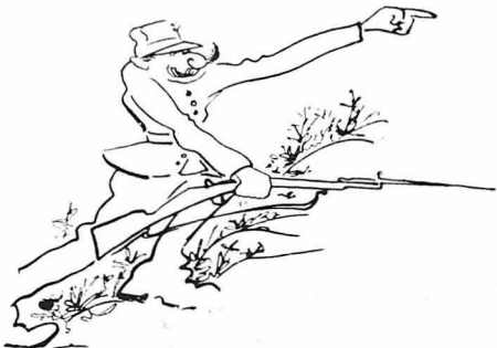
—Άπάνω τους, παιδιά!...