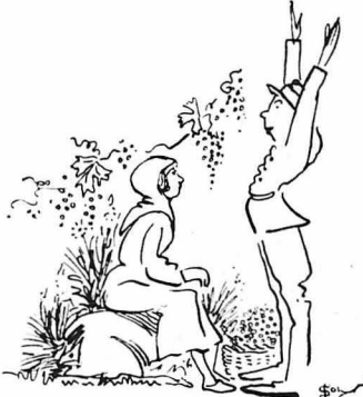
—Νά σου παραδοθώ αιχμάλωτος!...