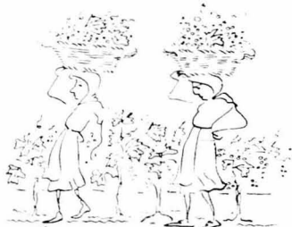
Η άρπαγή τραγουδούσε τα σταφύλια...

Η άρπαγή, είχε πάρει στη σειρά τα κλήματα και τραγουδούσε τα σταφύλια, τραγουδώντας το λαϊκό της έλεγχο τραγουδιού: