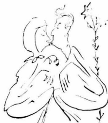
Γνώρισε φίλι και φιλιά!...