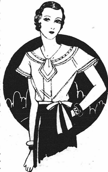
Μπουζα από κρέπ-ντε-σιν γαρυρισμένη με άζουο.