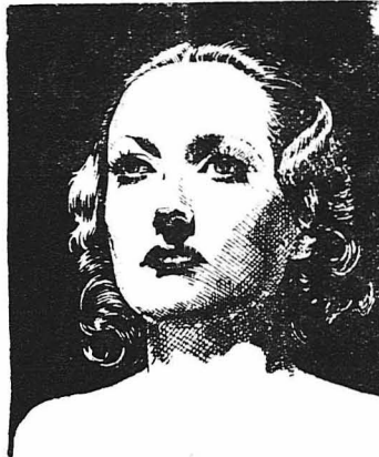
Η Τζόαν Κράουφορντ

ζουστουμ σπόρ, μάλιστα κομψό, σαν της Μάρλεν Ντήτριχ. Γενικώς ντύεται λίγο τσαπατσούλια, άγορίστικα, πράγμα που δεν της ταιριάζει ή κομψολογική Κόνστανς Μπέννετ, ή πιο καλοντυμένη γυναίκα του Χόλλυγουντ. Στην Μπέννετ, άλλως τε, δεν άρρασι τίποτε της Χέλμπορν. Την κάνει έξω φρενών η ρεζιλία που γίνεται τώρα γύρω της κι' εκφοβίζεται γι' αυτήν δημοσία δυσμενέστατα και χωρίς προσχήματα. Σε γκόλο άρρασι μεγάλο, όταν ζήτησαν την γνώμη της για τη Χέλμπορν, είπε: