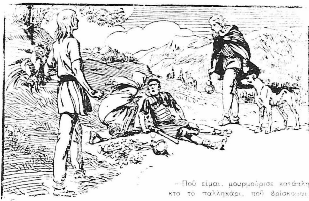
— Πού είμαι, μοιρομούρισε κατάρληστο το παλληγάρι, που βρισκόταν:

Και ή Έζώδη με δεινατός λευκόμοις του άποκρίθηκε: — Φοβήθηκαε για τη έσή σου, άγαπημένο μου... Έφηνες πόνιδόμορες με χιονόκαρο... Σε πρόφτασε ή θύελλα του δρόμου, και σε σέλασε το χιόνι... Βρισκόσουν νακοιμένος, κάπτε απ' τον άσπρο κροπό πέλο, δυό μέρες και δυό νύχτες... Χτές ξεποδούλαε ό ήλιος κι' έβλωσε τον πέπλο που σε σέλαπε... Μα σού ήσουν άναίσοθησε τελίως... Άνησυχόντας για την τύχη σου, από ένα όνειρο κακό που είδα, έτρεξα στον πατέρα σου και κλάθηκα παρ'ά... Βγήκαμε να σ' άντήρησομε και