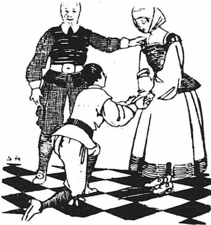
Γονάτισε μπροστὰ τῆς καὶ τῆς ἔσφιξε τὰ χέρια

Ἀγαπητὸ μου ἀναγνώστα, τὰ παραπάνω θέματα δὲν εἶνε τίποτε ἄλλο, ἀπὸ ἕνας θροῦλος τοῦ λαοῦ. Μὰ εἶμαι σίγουρος, πὺς ὁ σατανικὸς ἐκεῖνος γέρος ἰσχυρὸν στὴν πραγματικότητα, κι' ἀνοῦαζεται Ἐδβαφίος. Ἄν τὴν πετύχῃτε λοιπὸν καμῖα μέρα μπροστὰ σας, φροντίστε γιὰ τὴν ἐκμεταλλεθῆτε ἐαιδέξια, ὅπως ἔγινε κι' ὁ Κάρλος.