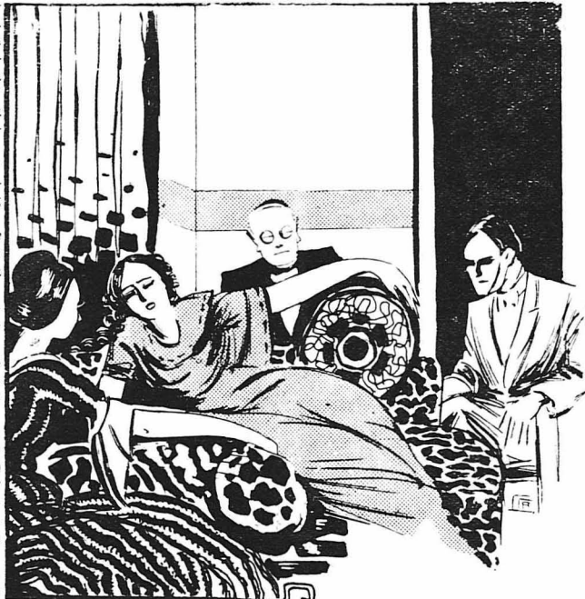
—Πολύ διασκεδαστικό, πράγματι! απάντησε η Άννιόσκα, χλωμιάζοντα.