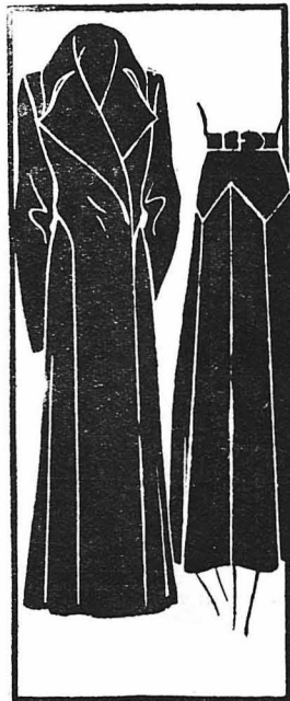
Η παραπάνω εικόνα δείχνει πως μπορούμε να μεταβάλλουμε σε μοντέρνα φούστα ένα ντυσιοντέ μας έπιανωφόρι.