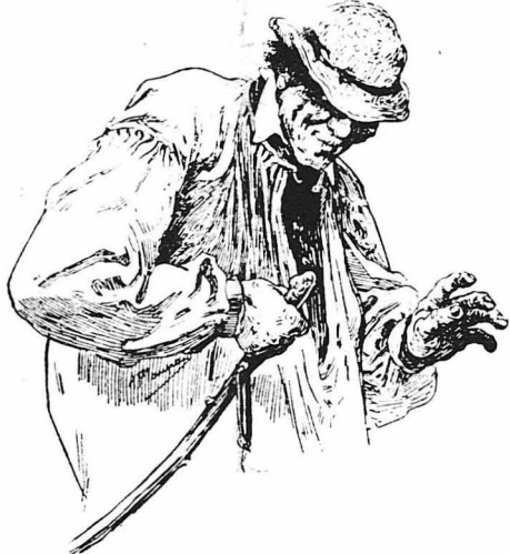
Ἦταν ἓνας γέρος μ' ἀσχημο πρόσωπο καὶ με μιά μπλουζά...

Ὁ λόρδος ἔμεινε γιὰ λίγο σκεφτιζός. Τί ἔπρεπε νὰ κάμη; Νὰ παρακοῦση τὸ Χόλμς; Νὰ φοροινδυνέση;... (Ἀκολουθεῖ)