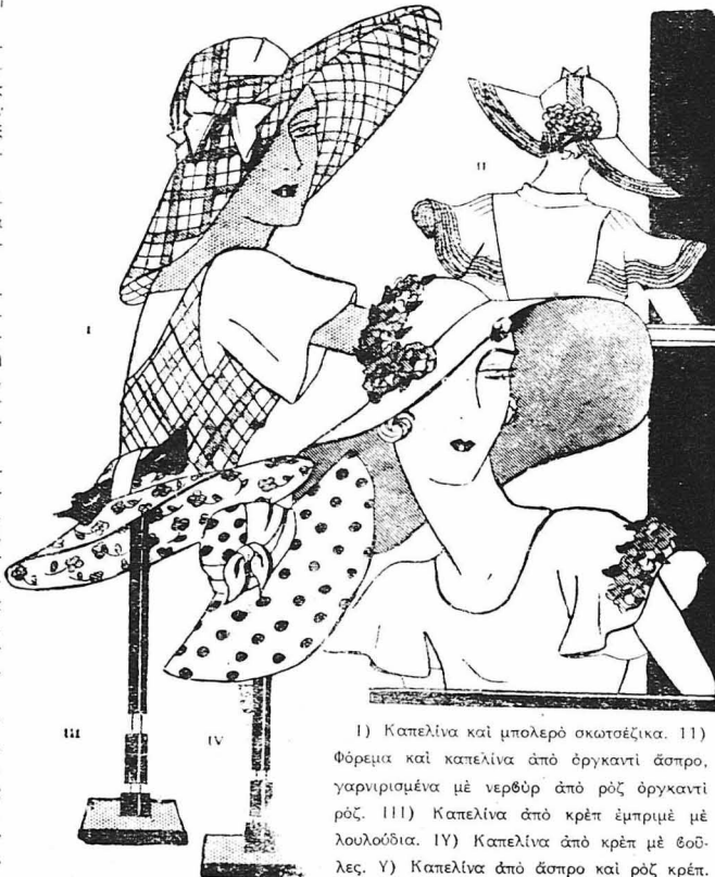
1) Καπέλινα και μολερό σκωτσέζικα. 11) Φόρεμα και καπέλινα από όργαντι άσπρο, γαρνιρισμένα με νεφθέρ από ροζ όργαντι ροζ. 111) Καπέλινα από κρέπ έμπριμπε με λουλούδια. 1V) Καπέλινα από κρέπ με βοϋλες. V) Καπέλινα από άσπρο και ροζ κρέπ.