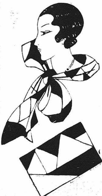
Έράρρα και τσάντα από διαφορετικά κομμάτια ύφρασματά.

Μ ά λ γ κ α ο ι. Ένταύθα. — Να μεταχειρισθήτε τό παφθενικό γάλα, προσθέτοντες σ' αυτό και δύο γραμμάρια βειξενί.